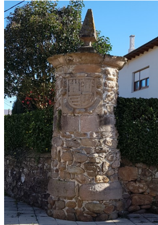
CUBOS DE SARO, MUNICIPIO DE SARO.