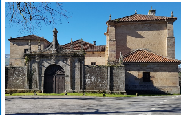
PALACIO GÓMEZ BARREDA, SARO